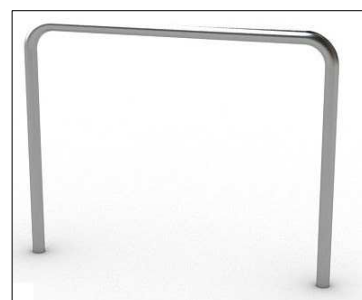
ST - stojaki rowerowe