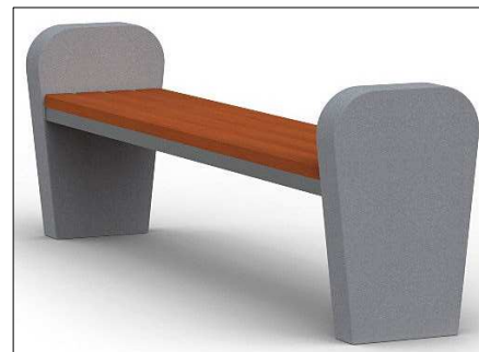
Ł2 - ławka bez oparcia