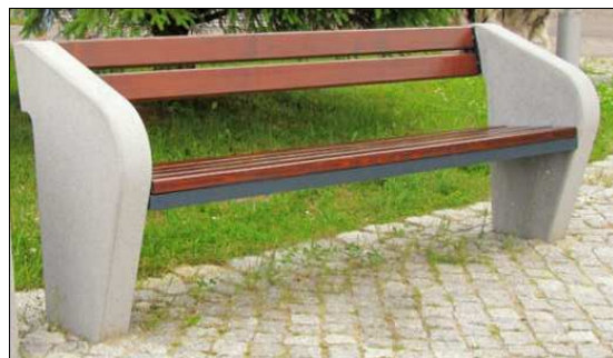
Ł1 - ławka z oparciem i podłokietnikami