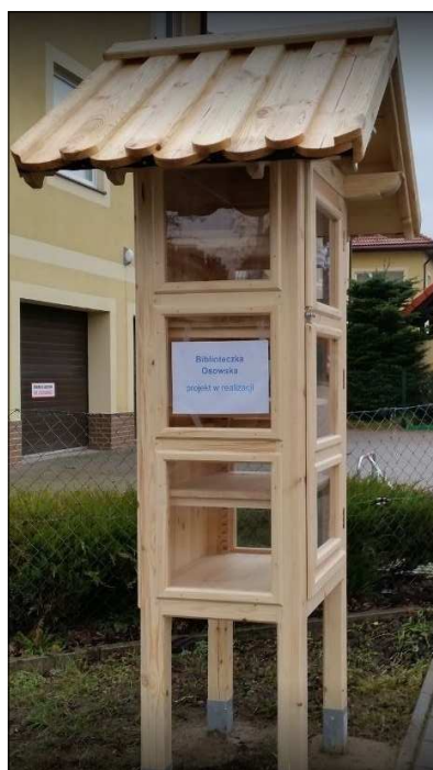
B - biblioteczka plenerowa