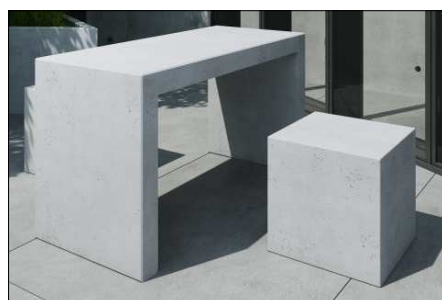
S - stół z planszami do gier w szachy i chińczyka