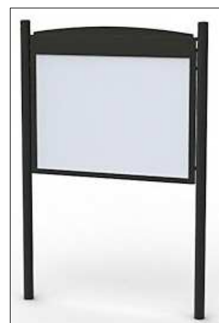
T - tablica ogłoszeniowa