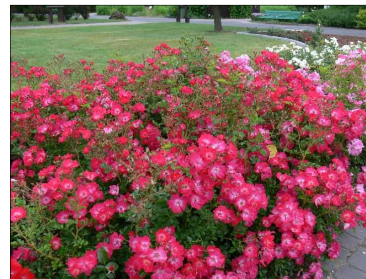
N5 - Róża 'Marathon'