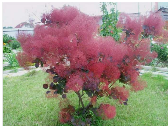
N2 - Perukowiec podolski 'Royal purple'