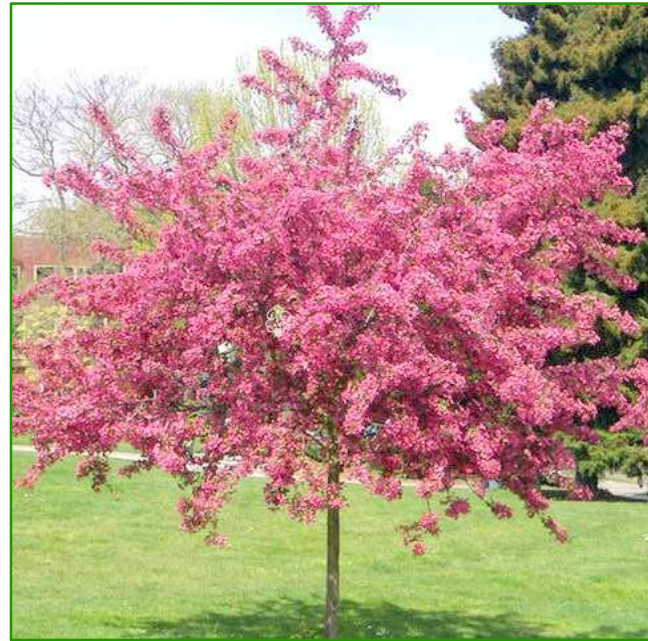
N1 - Głóg pośredni 'Paul's Scarlet'