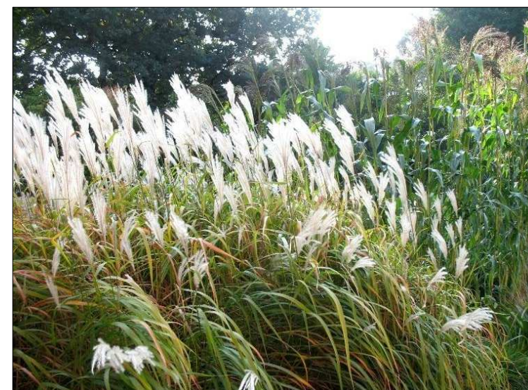
N4 - Miskant cukrowy