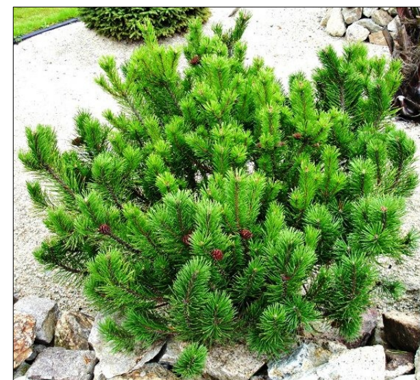
N3 - Sosna górská